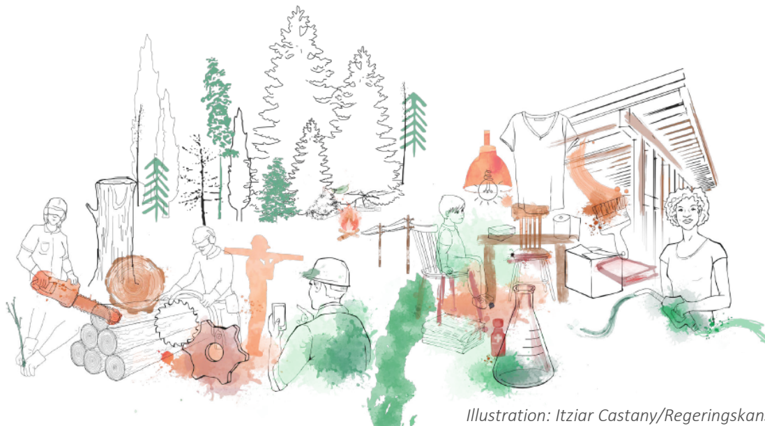
Illustration: Itziar Castany/Regeringskansliet

Förstudie i Norrbottens och Västerbottens län